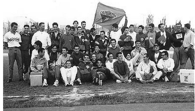
20 años en Primera División