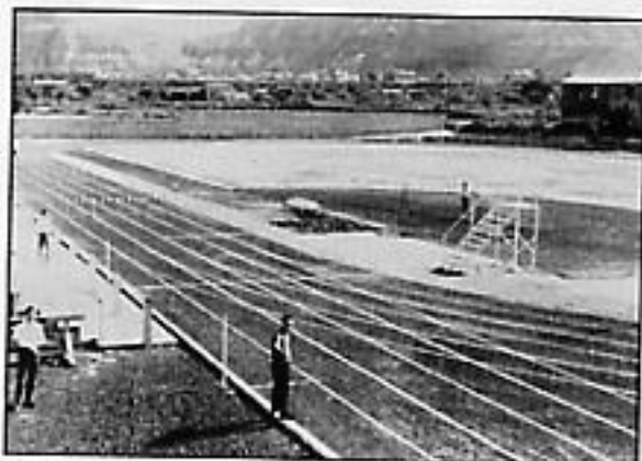
La pista de ceniza de los años 60.