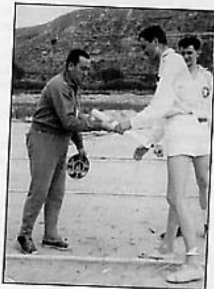
El Royal White Star A.C. en Monzón. Los capitanes intercambian regalos.