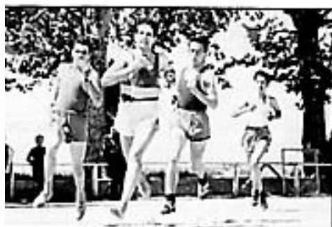
Carrera de 1.500 metros en La Arboleda.