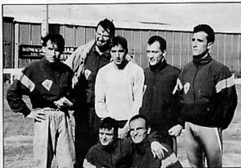
HOMBRES DE RANKING

Como infantiles fueron de lo mejor de España, pero abandonaron pronto y no llegaron donde prometían.