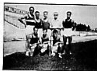
El Monzón en un Trofeo San Lorenzo en Huesca.