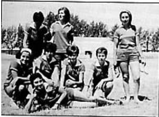
Las muchachas estrenando uniforme.