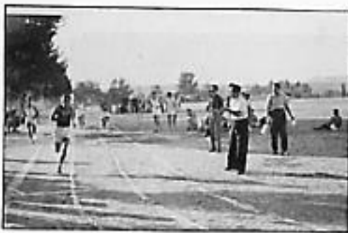
1948. La pista de la Arboleda en el primer Trofeo San Mateo.

La tercera pista llegó con el Trofeo San Mateo, en septiembre de 1990. Sintética y majestuosa, definitiva, es justo lo que el atletismo montisonense necesitaba.