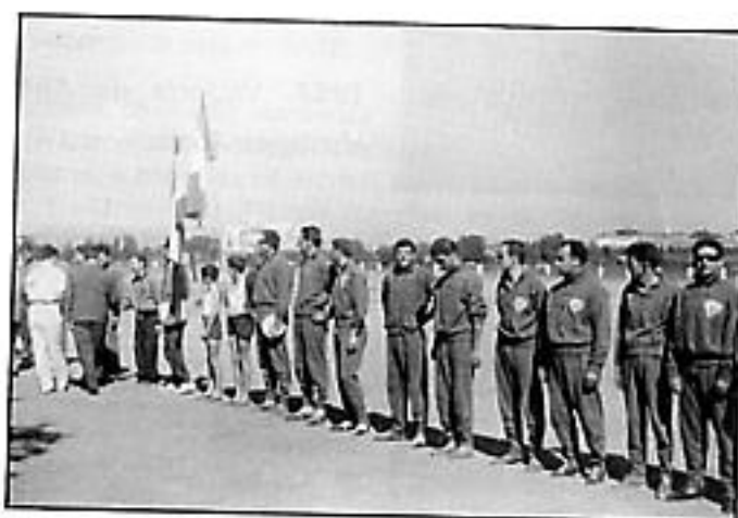
La selección de Armagnac-Bigorre visita Monzón en 1959. Es el primer encuentro internacional en Aragón.