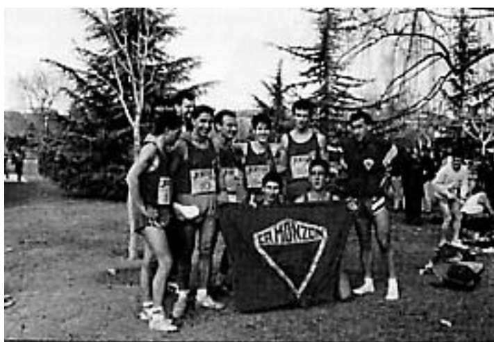
En el 93, en Teruel, de nuevo Campeones de Aragón