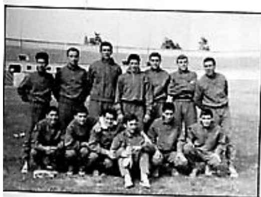
El CAM en el viejo Montjuich