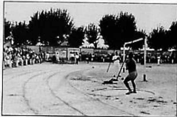
Un Trofeo San Mateo en los finales de los años 50 en La Arboleda.