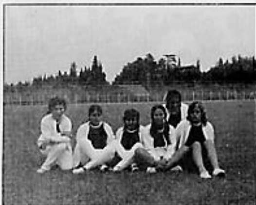
Muchachas en Avignon. 1971