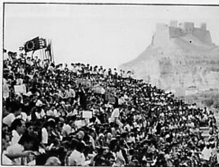
Aspecto que presentaba la tribuna de la nueva pista el día de la inauguración.