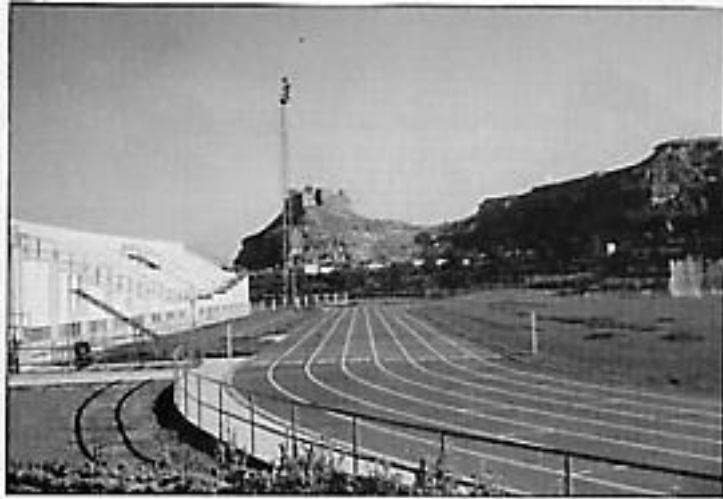
La extraordinaria pista sintética actual