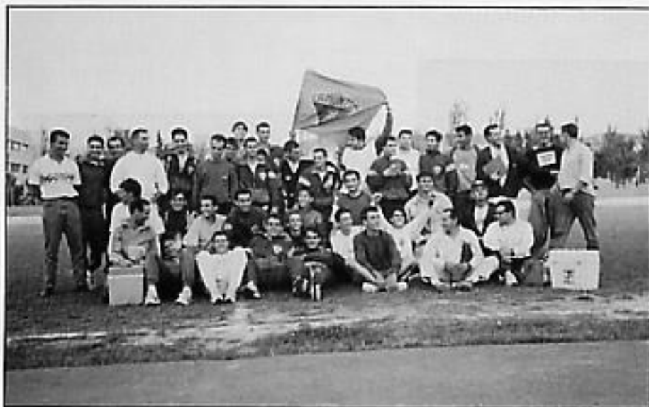
La foto del ascenso a primera en Zaragoza el 12 Junio 1993