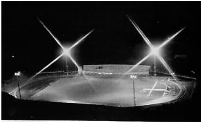
La nueva pista montisonense en visión nocturna