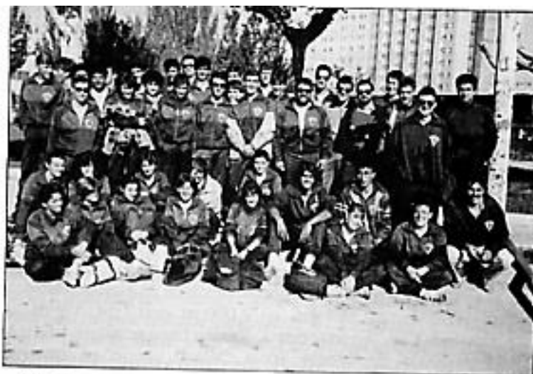
EL EQUIPO EN DIA DE ESTRENO DE UNIFORME