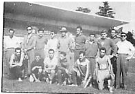
El CAM on su primera salida al extranjero. Auch (FRA) 1958.