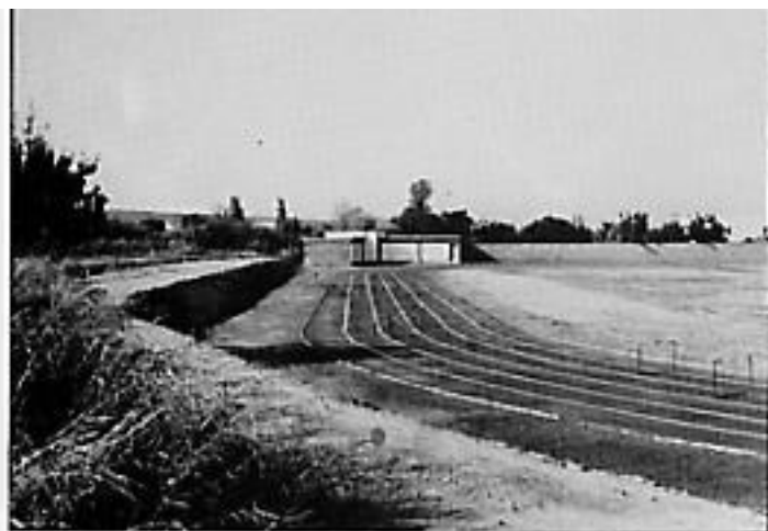
Otro aspecto de la pista de ceniza de la carretera de Pueyo.